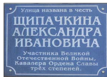
Улица им. А.И. Щипачкина. Г. Печора