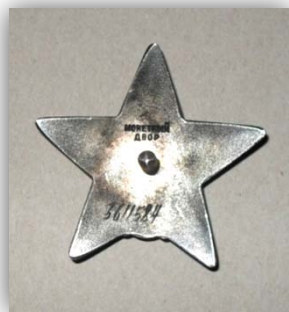
Орден Красной звезды. Оборотная сторона

В середине ордена помещен щит с изображением фигуры красноармейца в шинели и буденовке с винтовкой в руках. По ободу щита расположена надпись «Пролетарии всех стран, соединяйтесь!», в нижней части обода – надпись «СССР».